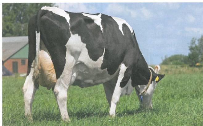
I august 2014 skifter avlsværdital for krop navn til kropskapacitet.

For RDC og Jersey er den eneste forskel mellem kropskapacitet og krop navnet. For Holstein har kropskapacitet en anden sammensætning, end krop havde tidligere. Baggrunden for ændringen er,